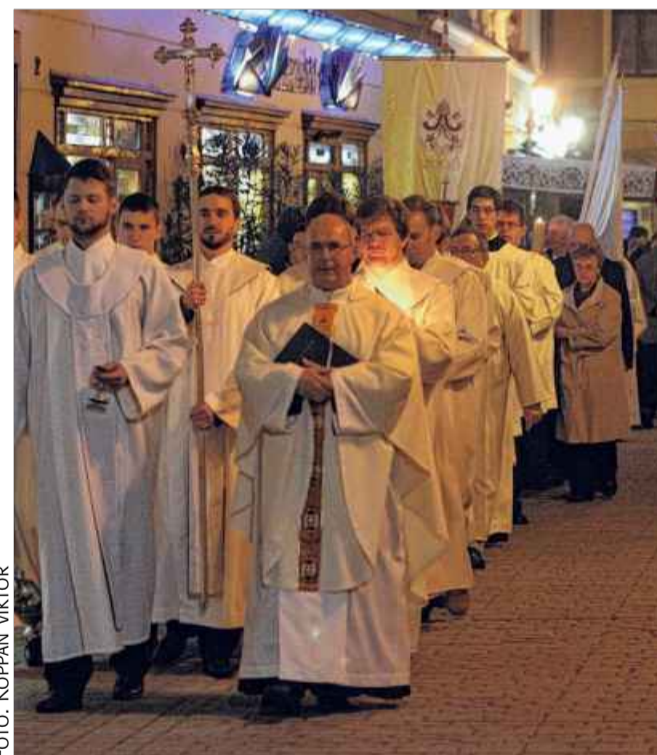
Sokan eljöttek a Jézus feltámadását ünneplő körmenetre

és viszont. Egyikük a rendőrségen, másikuk az ügyészségen teszi meg a feljelentést, két magánvádas ügy kerül a bíróságra, egyikben „A” a vádlott, másikban „B”. Folyik a két magánvádas büntetőügy, de még a polgári per sem zárul le. Múlik az idő, a polgári per sok év után – mely évek alatt ismét összeremegetik egymást párszor – a Kúriára kerül, közben az egyik magánvádas tárgyalásra nem megy el a vádló, az ügy megszűnik. A másik első fokon a vádlót felmentésével zárul, a vádló természetesen fellebbez. Másodfokon a törvényszéki büntetőtanács eljárás szabálytalanságok tömkelege miatt új eljárásra kötelezi az első fokú bíróságot – ez volt a múlt héten –, azaz minden kezdődik előlről. Tegnap „A” telefonált, hogy olyan dokumentumokat szerzett „B” cégről, hogy azokkal most aztán végképp kinyírja a szomszédot. Menjek – mondta –, nézzem meg a papírokat és rántsuk le a leplet „B”-ről! Tartok tőle, hogy a leplezés után „B” is előás valamit „A”-ról... A tanulságok fontosak, a konkrét történet kevésbé. De mi lesz, ha egyszer tényleg folyik a vér?!